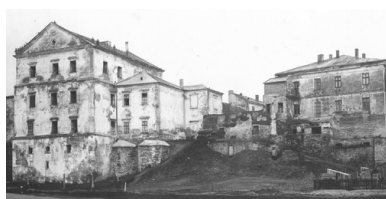
Zamek w Tarnopolu w roku 1929, przed odbudową

Tereny te po 1945 r. zostały odebrane Polsce i na mocy porozumień jałtańskich włączone do ZSRS. Ziemia tarnopolska była świadkiem dramatycznych wydarzeń dla Narodu polskiego. Pierwsza okupacja sowiecka przyniosła represje, aresztowania i wywózki, okupacja niemiecka – zbrodnie hitlerowskie, Holocaust i ludobójczą politykę OUN-UPA. W końcu po ponownym wkroczeniu Sowietów Polacy, w ramach celowej depolonizacji Kresów Wschodnich RP, musieli porzucić swoją ziemię i domy, byli przymusowo wysiedlani lub zmuszani do ucieczki. Jest to tym bardziej wstrząsające, gdy uświadomimy sobie, że do języka polskiego jako ojczystego przyznawała się prawie połowa ludności przedwojennego województwa tarnopolskiego.