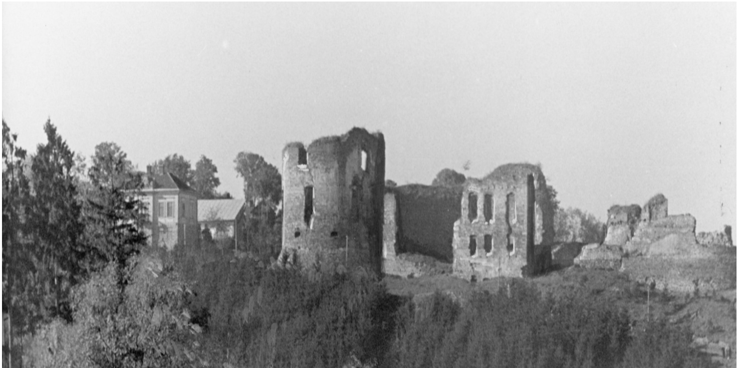
Ruiny Zamku w Buczaczu

https://przystanekhistoria.pl/pa2/tematy/armia-krajowa/62814,Okreg-AK-Tarnopol.html