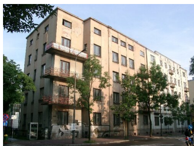
Dawna siedziba WUBP w Kielcach przy ul. Paderewskiego 10/12.