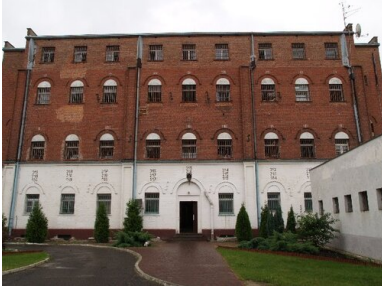
Więzienie w Goleniowie przy ul. Grenadierów 66.