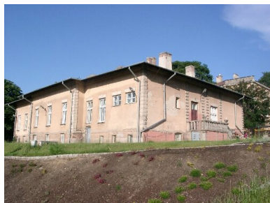
Dawna siedziba Powiatowego i Miejskiego Urzędów Bezpieczeństwa Publicznego w Kielcach przy ul. Kapitulnej 2.