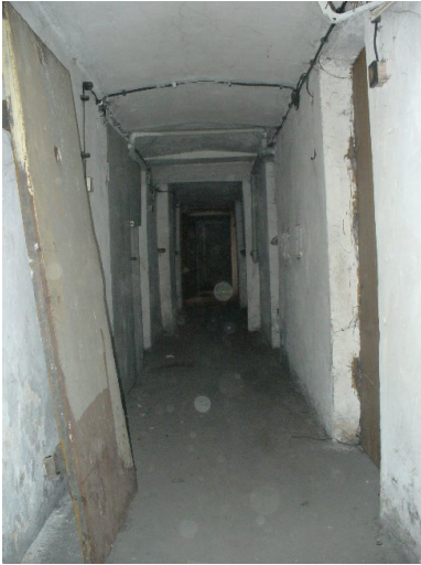
Piwnica w budynku dawnej siedziby Wojewódzkiego Urzędu Bezpieczeństwa Publicznego w Kielcach (ul. Paderewskiego 10/12).