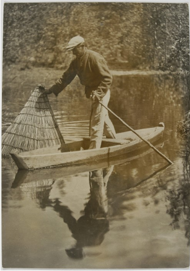
Polska, Polesie. Łowienie węgorki.