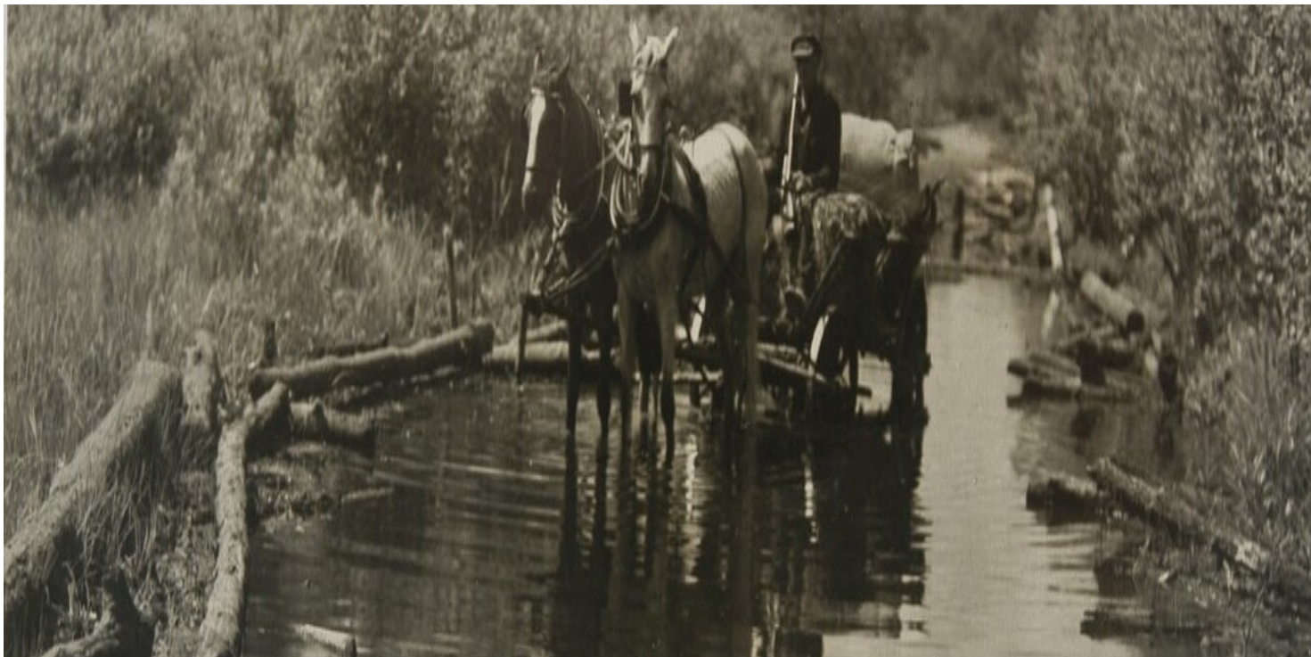
Polska, Polesie.

https://przystanekhistoria.pl/pa2/tematy/armia-krajowa/89401,Smierc-poetki-Krystyna-Krahelska-19141944.html