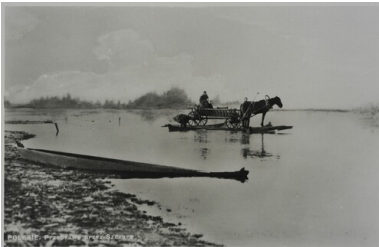
Polska, Polesie. Przeprowa przez Szczarę.

Niewątpliwie twórczość „Danuty” rozwijała się pod wpływem wojennych wydarzeń. Z lirycznych wierszy z kraju dzieciństwa, pejzaży i ulotnych chwil, z kresowych nostalgii powstawała poezja zarazem świadomej już egzystencji, jak również odpowiedzialności i walki, poezja obowiązku wobec niebezpieczeństwa zniszczenia i zagłady, poezja tyrtcjska, walcząca, heroiczna, często uproszczona do formy słowno-muzycznej piosenki, zagrzewającej do boju, ale też refleksyjna z wątkami religijnymi. Jeszcze przed wojną Krahelska napisała