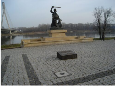
Widok warszawskiej Syrenki nad Wisłą.

Po jej śmierci ta okoliczność nabierała znaczenia. Powoli rosła legenda poetów-żołnierzy, którzy wybierali karabin zamiast pióra, gdy przyszło bronić wspólnej sprawy; poetów, którzy w swym słowie i pieśni pozostawiali testament dla następnych pokoleń. Ta legenda, siłą rzeczy, wyrastała z ich śmierci i z pamięci następców, którzy nie mogli i nie chcieli zapomnieć. A wyrastała najpierw konspiracyjnie, bo przez pierwsze dziesięciolecie komunistycznych rządów w Polsce była usuwana i niszczone. Zastępowano ją inną, czarną legendą „bandytów z AK”. Pokolenie wojennych poetów, ich słowo i czyn miały zostać przemilczane i zapomniane.