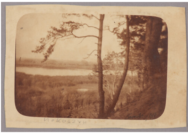
Krajobraz z Mokoszyna, 1915 - 1918.

Pierwsza z trzech masowych wywózek została przeprowadzona 10 lutego 1940 r. Objęto nią około 140 tys. osób, mieszkańców wschodnich województw II Rzeczypospolitej. Większość zabranych stanowili Polacy (82 proc.), pozostali to Ukraińcy (8,8 proc.) i Białorusini (8,1 proc.). Działania Rosji sowieckiej prowadzone wobec polskich obywateli pozostają niezwykle bolesnym świadectwem, czym w istocie był komunizm.