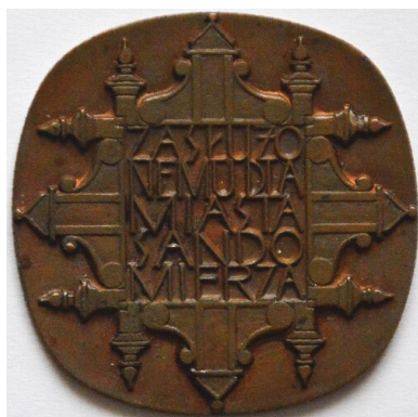
Awers medalu Zasłużony dla miasta Sandomierza.