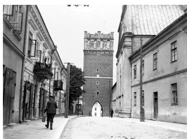
Sandomierz, lata 30. XX w. Widok na Bramę Opatowską od strony miasta.