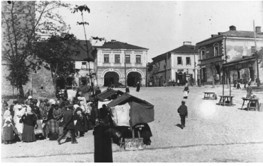
Okres Drugiej Rzeczypospolitej. Fragment rynku sandomierskiego z widocznymi straganami. Na wprost kamienica Oleśnickich z charakterystycznymi podcieniami. Ze zbiorów NAC