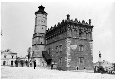
Sandomierz, lata 30. XX w.