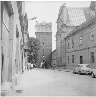
Sandomierz, lata 70. XX w. Ulica Opatowska. W oddali Brama Opatowska. Z prawej kościół Św. Ducha.