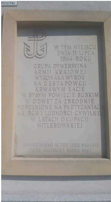
Miejsce wykonania zamachu.

27 lipca 2014 r. Buskie Stowarzyszenie „Pro Memoria” wraz z Buskim Samorządowym Centrum Kultury zorganizowało inscenizację historyczną zamachu na Petera.