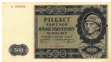
Okupacyjna „młynarka” - 500 złotych z 1940 r., tak zwany góral

To, co łączyło tę – dość eklektyczną – zbiorowość, a co wynikało z jej ochotniczego charakteru, to spory atut w postaci silnego ładunku świadomego patriotyzmu, jakim charakteryzowała się, a przynajmniej powinna, znaczna część członków wstępujących (przecież z własnej woli) w szeregi AK. Z drugiej jednak strony – o czym warto pamiętać – ten ochotniczy charakter niósł ze sobą także duże zagrożenie anarchizacją, kłopotami z utrzymaniem dyscypliny, zwłaszcza w relacjach z dowództwem, które musiało nauczyć się teraz zdobywać autorytet w inny sposób, niż to miało miejsce na placach koszarowych i poligonach wojskowych. W tym kontekście coraz większego znaczenia nabierał „własny przykład”, a nie zasada „ślepego posłuszeństwa”, wynikająca wprost ze stopnia wojskowego. Nieprzypadkowo to właśnie oficerowie rezerwy – a więc cywile – po przeszkoleniu wojskowym lepiej odnajdywali się w tej nowej i specyficznej sytuacji niż oficerowie zawodowi przepojeni starymi nawykami.