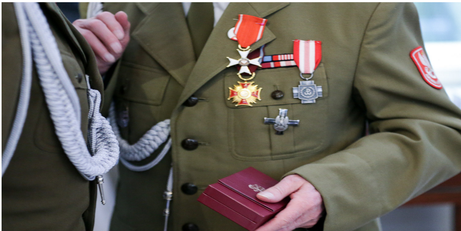
Uroczystość wręczenia Orderów Odrodzenia Polski w Belwederze, 2016 r. Na mundurze weterana widoczny również m.in. Krzyż Armii Krajowej

https://przystanekhistoria.pl/pa2/tematy/armia-krajowa/97101,Ustanowienie-Krzyza-Armii-Krajowej.html