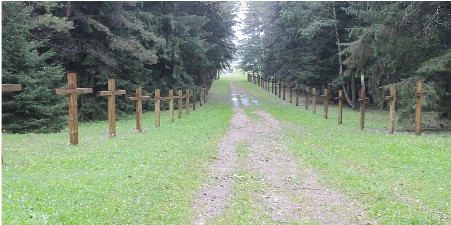
Uroczysko Kuropaty, fot. IPN

https://przystanekhistoria.pl/pa2/tematy/bialorus/105868,Kuropaty-miejsce-masowych-egzekucji-sowieckich.html