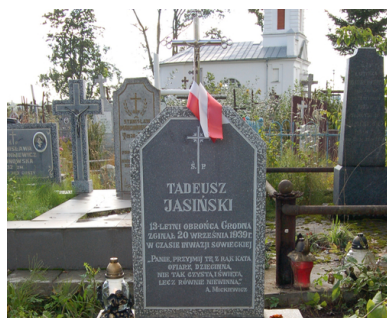
Grób Tadeusza Jasińskiego, najmłodszego obrońcy Grodna

poddano także żołnierzy polskich. Rozstrzelano m.in.: ok. 300 obrońców Grodna czy ok. 150 marynarzy Flotylli Pińskiej, zamordowano gen. Józefa Olszynę-Wilczyńskiego, dowódcę Okręgu Korpusu nr III Grodno i jego adiutanta kpt. artylerii Mieczysława Strzemeskiego.