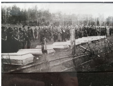
Pogrzeb poległych w bitwie o Murowaną Oszmiankę partyzantów 3. Brygady