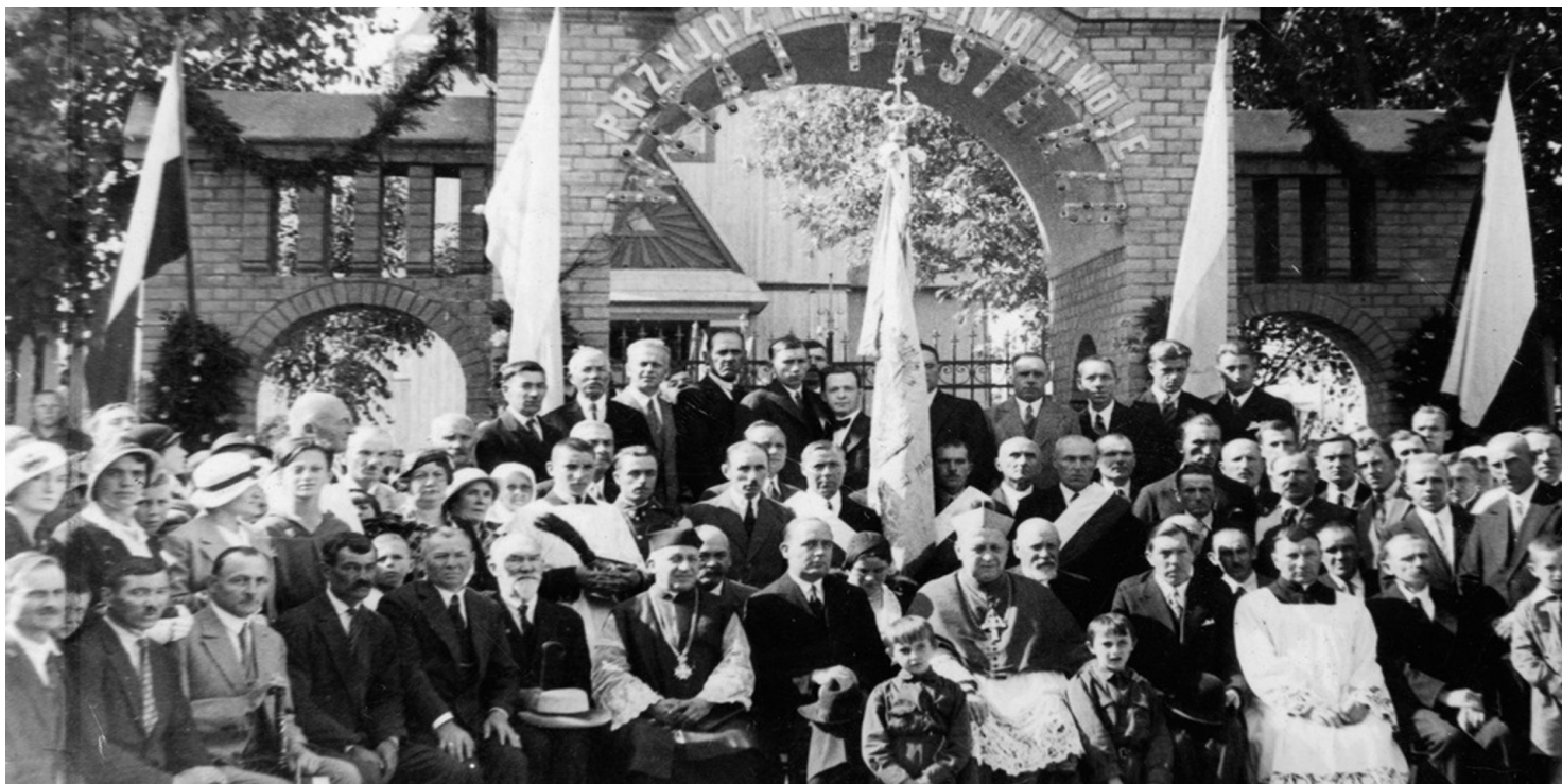
Poświęcenie bramy kościelnej w Baranowiczach, 1934 r.

https://przystanekhistoria.pl/pa2/tematy/bialorus/95242,Meczennicy-ziemi-nowogrodzkiej.html