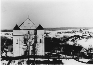
Kościół Przemienienia Pańskiego w Nowogródku, ok. 1930 r.