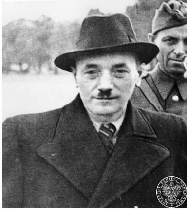
Bolesław Bierut