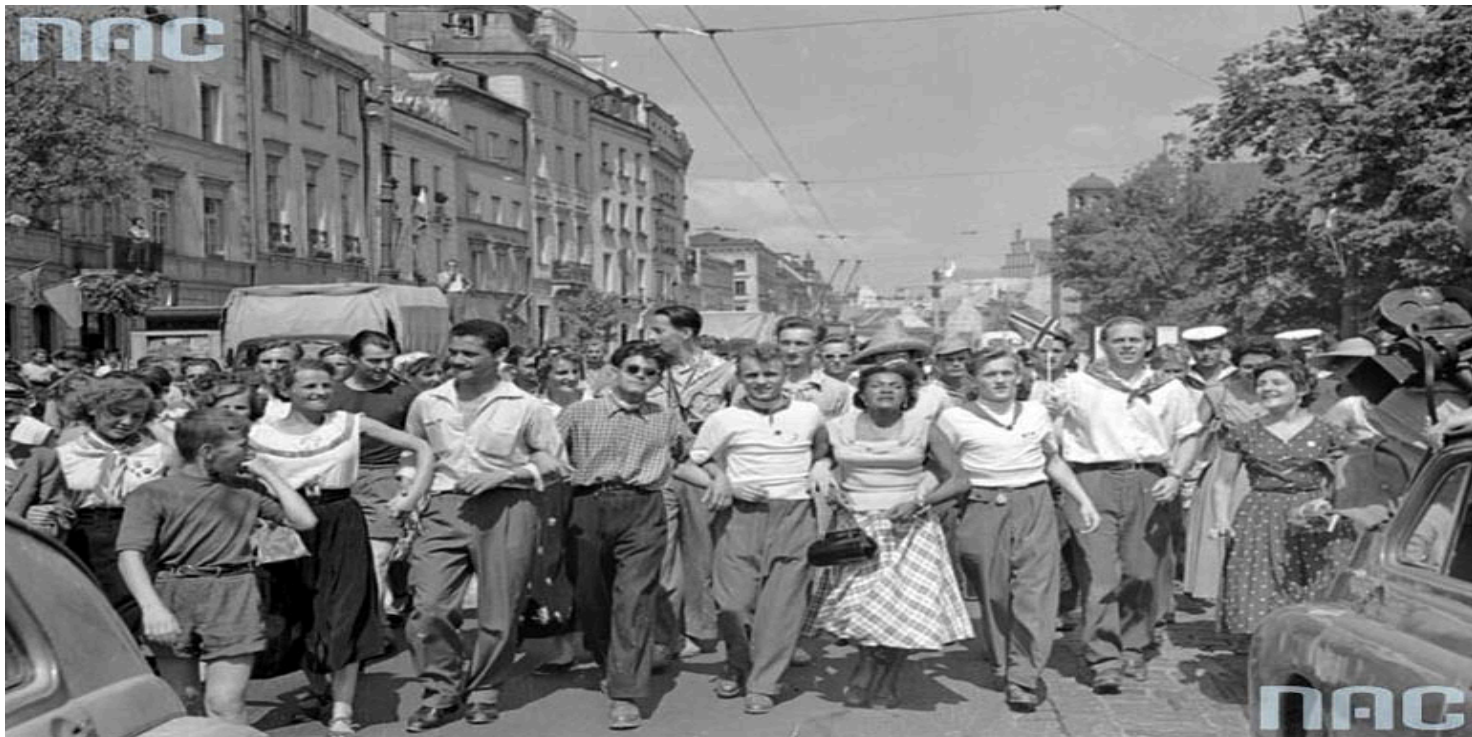
V Światowy Festiwal Młodzieży i Studentów w Warszawie

https://przystanekhistoria.pl/pa2/tematy/boleslaw-bierut/103969,Odwilz-pod-kontrola.html