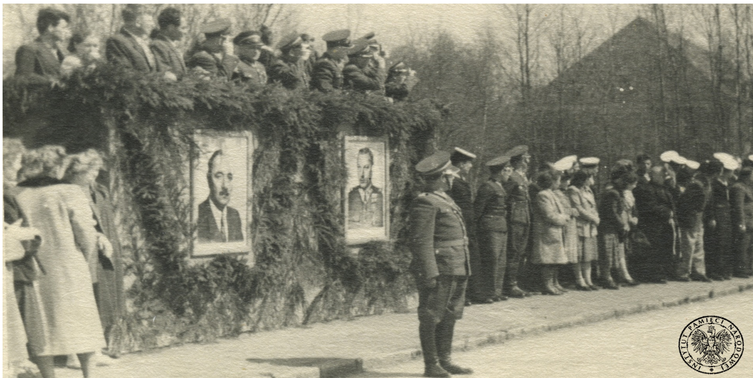
Portrety Bolesława Bieruta i Konstantego Rokossowskiego przywieszone do trybuny honorowej podczas obchodów święta 1 Maja w jednostce wojskowej w Dziwnowie w 1950 r.

https://przystanekhistoria.pl/pa2/tematy/boleslaw-bierut/82048,Wokol-kultu-Bieruta.html