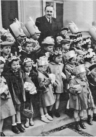
Belweder, 1951 r. Urodziny Bolesława Bieruta