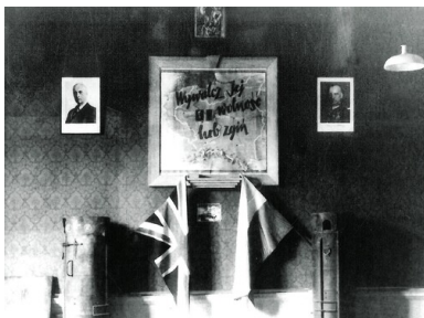
Sala wykładowa w Audley End; na mapie zawołanie formacji cichociemnych.

Kurs walki konspiracyjnej w Briggens, trwający dla różnych grup od trzech do ośmiu tygodni, obejmował organizowanie sabotażu i dywersji małym zespołem na konkretne obiekty.