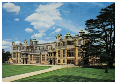
Audley End, ośrodek szkolenia cichociemnych, lata powojenne.

Baza, zgodnie z instrukcją, miała za zadanie zbudowanie i utrzymanie szlaku łączności z krajem na odcinku od brzegów włoskich, przez Adriatyk i Jugosławię, do granicy Węgier i z powrotem; organizowanie i kierowanie ewakuacją wojskową z terenu Jugosławii i Albanii przy współudziale komórek wojskowych Ministerstwa Obrony Narodowej, m.in. Misji Morskiej, a także zbieranie (niezbędnych dla prac Oddziału VI) informacji politycznych oraz danych o warunkach bytu i poruszania się z Europy Centralnej i Bałkanów. Ponadto miała utrzymywać kontakt radiowy z terenem operacji i przysyłać informacje do Sztabu Naczelnego Wodza. Jednostki te podlegały za pośrednictwem kierownictwa Bazy „Elba”, która mieściła się w mieście Latiano – 23 km na południowy zachód od Brindisi – Oddziałowi VI Sztabu NW w Londynie.