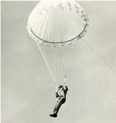
Skok spadochronowy.

Przyszłych skoczków kierowano też czasem na dwutygodniowe szkolenie z zagadnień informacyjno-wywiadowczych, obejmujące zarówno posługiwanie się szyframi, podrabianie dokumentów, używanie atramentu sympatycznego, stwierdzanie autentyczności dokumentów, pieczętek, jak i podrabianie kluczy oraz zacieranie za sobą śladów.