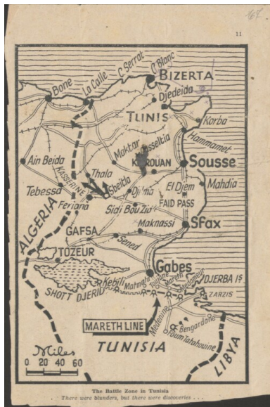
Mapa strefy działań wojennych w Tunezji w czasie II wojny światowej.