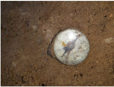
Kompas znaleziony w grobie pod murem cmentarza w kwietniu 2019 r.

W grobie znaleziono tylko jeden szkielet ludzki, jednak wielkość i kształt jamy grobowej oraz niektóre znalezione przedmioty (dwa grzebienie, dwa niezbędniki) wskazywały, że pierwotnie było tam pogrzebanych więcej osób. Szkielet spoczywał na dnie stosunkowo płytkiej jamy – na głębokości 1,31 m – na plecach, z głową zwróconą ku zachodowi. Ułożony był w pozycji anatomicznej, jednak z kilkoma zaburzeniami – brakowało obu podudzi, a obie kości udowe nosiły ślady ukośnych cięć. Można zatem podejrzewać, że obrażenia te powstały podczas pospiesznej ekshumacji w październiku 1939 r., a zadano je szpadlem. W ten sam sposób można również tłumaczyć brak lewego przedramienia i ślad analogicznego cięcia na lewej kości ramiennej.