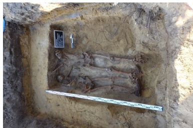
Szczałki ludzkie odnalezione w grobie wojennym w Starym Ochędzynie, listopad 2020 r.

polski guzik wojskowy, fragment maski gazowej, dwa żelazne niezbędniki składane, klamry żelazne, fragmenty skórzanych pasków i fragmenty tkanin (w tym czapek rogatywek). Biorąc pod uwagę fakt, że w grobie spoczywały początkowo szczątki trzech żołnierzy, trudno jest te przedmioty przypisać do konkretnych osób. Wyjątek stanowi bagnet Lebel wz. 1886 w pochwie znaleziony pod lewą kością udową szkieletu. Należy przyjąć, że bagnet pierwotnie był przytroczony do pasa poległego żołnierza i stanowił jego osobiste wyposażenie.