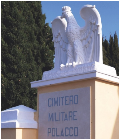
Orzeł strzegący polskich grobów na Polskim Cmentarzu Wojennym w Casamassimie