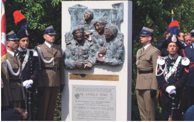
Tablica upamiętniająca wyzwolenie Imoli przez 2. Korpus Polski

Miejscowość została wyzwolona 17 kwietnia 1945 r. przez zgrupowanie „RUD” gen. Klemensa Rudnickiego w ramach wznowionej ofensywy na Bolonię. W siedemdziesiątą rocznicę tego wydarzenia miejscowe władze odsłoniły nad brzegiem rzeki Sillaro niewielki pomnik z terakotową płaskorzeźbą przedstawiającą walki polskich żołnierzy o miasto.