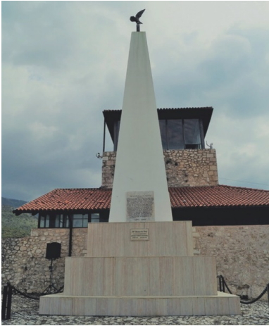
Pomnik 6. Pułku Pancernego „Dzieci Lwowskich” w Piedimonte