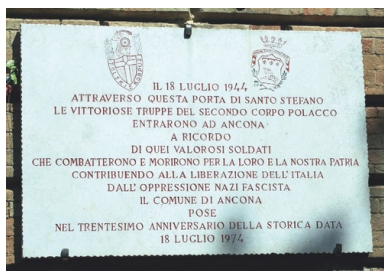
Tablica upamiętniająca wejście do Ankony oddziałów 2. Korpusu Polskiego 18 lipca 1944 r.

2. Korpus Polski podszedł pod Ankonę w trakcie działań pościgowych prowadzonych wzdłuż Adriatyku od połowy czerwca do połowy lipca 1944 r. Dzięki manewrowi oskrzydłającemu 5. Kresowej Dywizji Piechoty, po dwudniowych walkach, 18 lipca 1944 r., do miasta wkroczyli żołnierze 3. Pułku Ułanów Karpackich i 2. Batalionu Strzelców Karpackich. Przełamanie niemieckich pozycji nastąpiło na osi dziewiętnastowiecznej bramy fortecznej Porta Santo Stefano, która obecnie jest miejscem upamiętniającym zwycięstwo polskich żołnierzy. Polegli w walkach w rejonie Ankony spoczywają na polskim cmentarzu wojennym w Loreto. Po wyzwoleniu Ankony ulica prowadząca od bramy św. Stefana otrzymała nazwę Pułku Ułanów Karpackich. Obecnie jest to plac 2. Korpusu Polskiego. Na zewnętrznej stronie bramy zawieszono tablicę upamiętniającą wkroczenie Polaków do miasta.