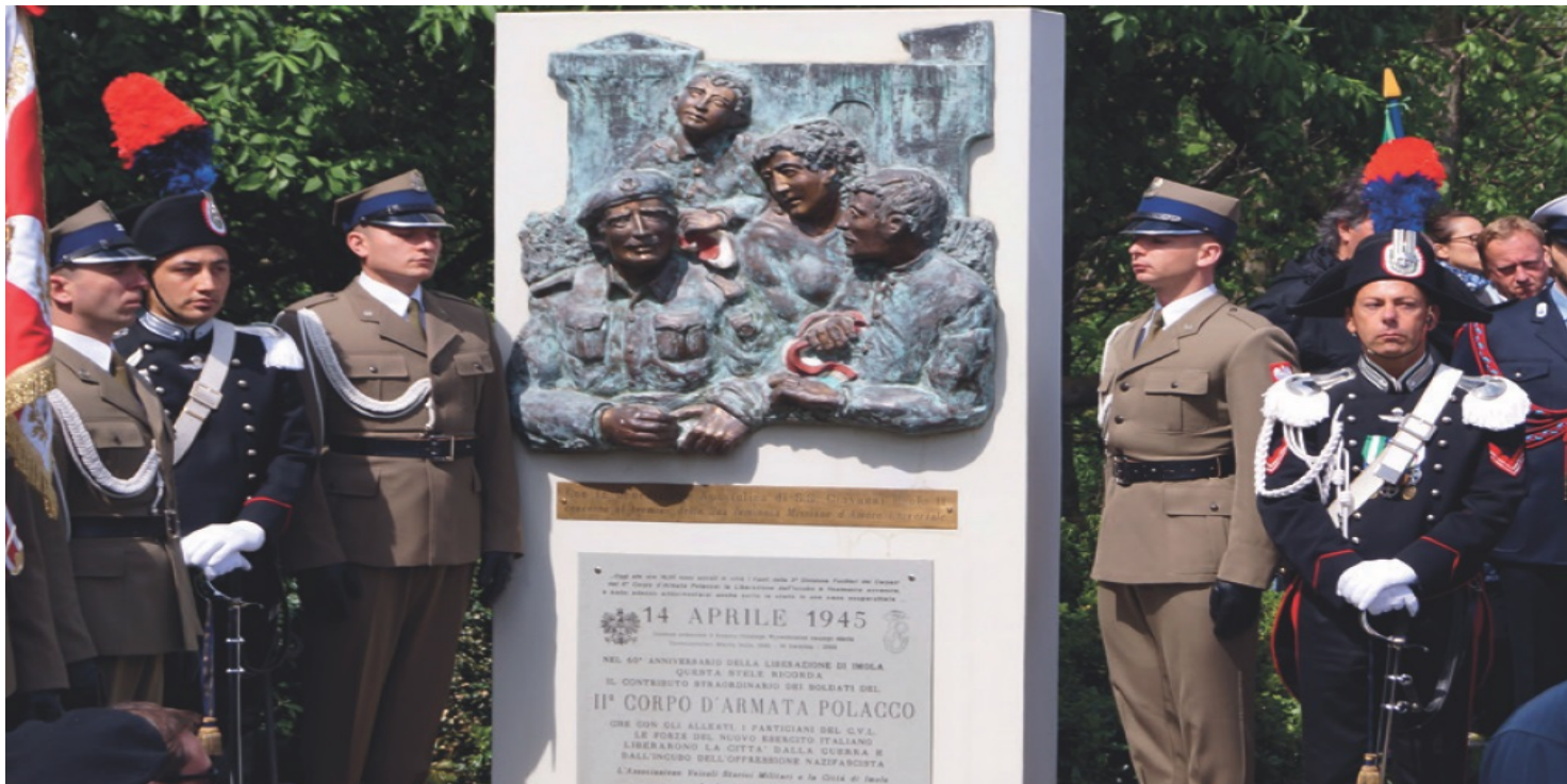
Tablica upamiętniająca wyzwolenie Imoli przez 2. Korpus Polski

https://przystanekhistoria.pl/pa2/tematy/cmentarze/96187,Nie-tylko-Monte-Cassino-Polskie-miejsca-pamieci-w-e-Wloszech.html