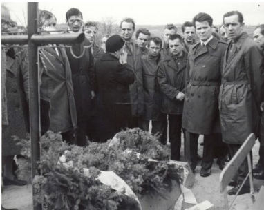
Delegacja gdańskich stoczniowców składa wieńce na grobie zabitych w Grudniu '70 na cmentarzu św. Franciszka w Gdańsku-Emaus, 8 maja 1971 r.