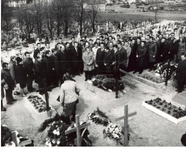
Delegacja gdańskich stoczniowców składa wieńce na grobie zabitych w Grudniu '70 na cmentarzu św. Franciszka w Gdańsku-Emaus, 8 maja 1971 r.