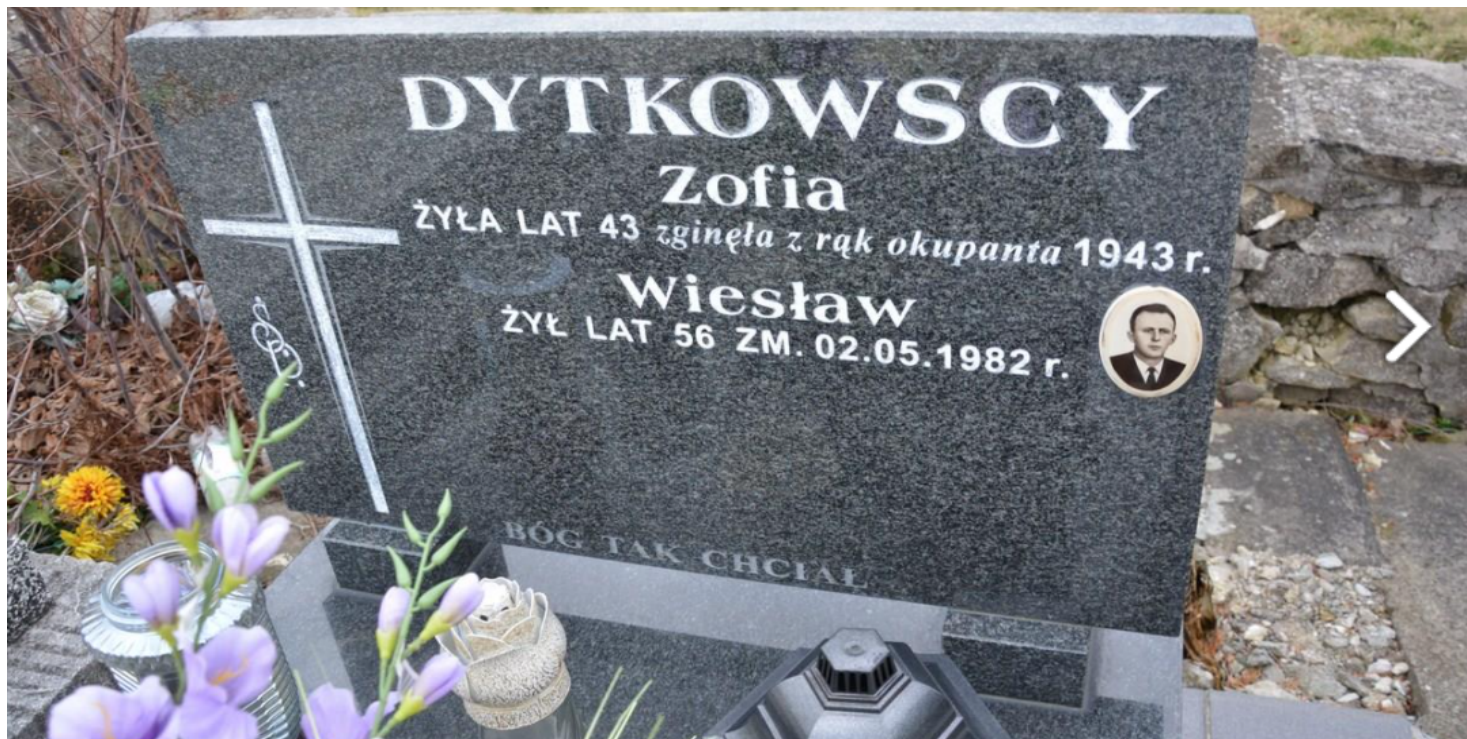
Grób Zofii Dytkowskiej

https://przystanekhistoria.pl/pa2/tematy/cmentarze/96231,Zbrodnie-niemieckie-popełnione-na-cmentarzu-żydowskim-w-Busku-Zdroju.html