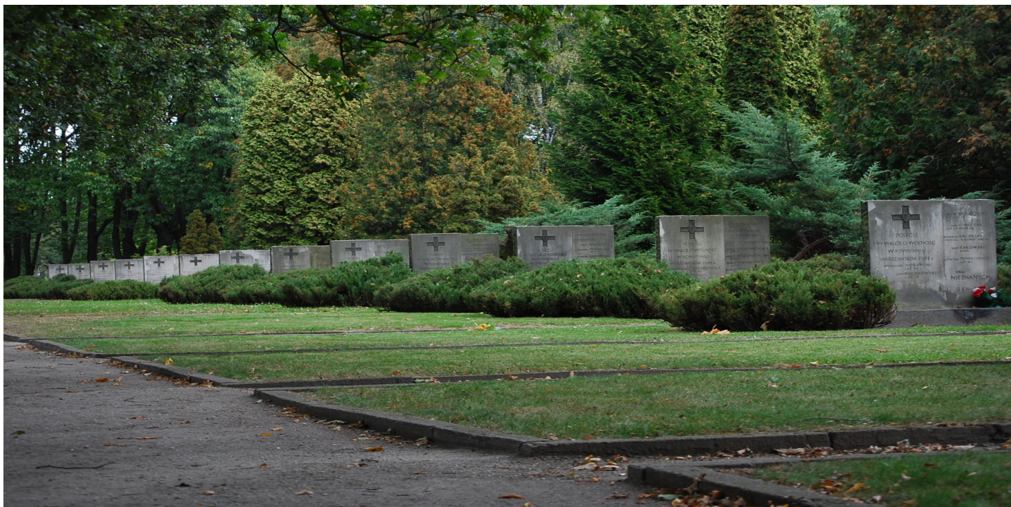
Cmentarz Powstańców Warszawy (2009).

https://przystanekhistoria.pl/pa2/tematy/cmentarze/96964,Nekropolia-Powstania-Warszawskiego.html