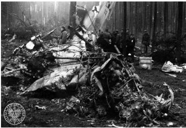
Szczątki samolotu rządowego Antonow AN-24W, który rozbił się w pobliżu lotniska Szczecin-Goleniów nocą, 28 II 1973 r.