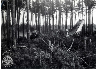
Szczątki samolotu rządowego Antonow AN-24W, który rozbił się w pobliżu lotniska Szczecin-Goleniów nocą, 28 II 1973 r.