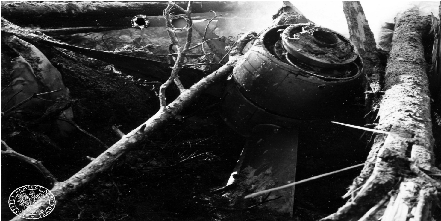
Szczątki samolotu rządowego Antonow AN-24W, który rozbił się w pobliżu lotniska Szczecin-Goleniów nocą, 28 II 1973 r.

https://przystanekhistoria.pl/pa2/tematy/czechoslowacja/105894,Katastrofa-rzadowego-samolotu-AN-24W-pod-Goleniowem.html