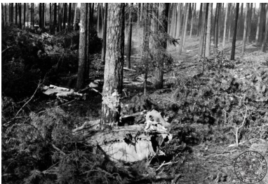
Szczątki samolotu rządowego Antonow AN-24W, który rozbił się