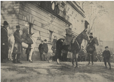
Jerzy Szczurek (w centrum, na koniu) w czasie przysięgi Milicji Polskiej Śląska Cieszyńskiego w Cieszynie.