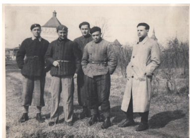
Grupa czeskich oficerów podczas

Już 3 września 1939 r. prezydent Ignacy Mościcki wydał dekret o utworzeniu Legionu Czechów i Słowaków w Wojsku Polskim. Dowódcą został gen. Lev Prchala. Był to pierwszy przypadek oficjalnego uznania czechosłowackiego ruchu oporu za granicą. Niemniej jednak sytuacja na froncie nie była obiecująca. Legion nie dysponował niemal żadnym sprzętem ani uzbrojeniem. 11 września 1939 r. jednostka w Leśnej pod dowództwem ppłk. Ludvíka Svobody rozpoczęła marsz na południe.