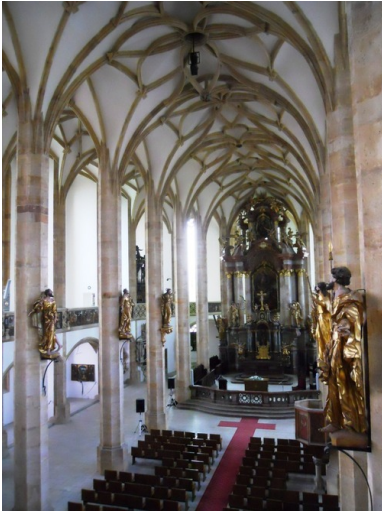
Obecny Most (Czechy), wewnątrz kościoła Wniebowzięcia Najświętszej Marii Panny.

Wyburzenie Mostu nie było przypadkiem jednostkowym, zgodnie z szacunkami z lat dziewięćdziesiątych, w okresie lat 1975-1985 władze doprowadziły do wyburzenia 10% obiektów zabytkowych, aby zrobić miejsce dla bloków i mieszkań z tanich komponentów. W konsekwencji wyburzono ok. 3 000 nieruchomości zabytkowych.