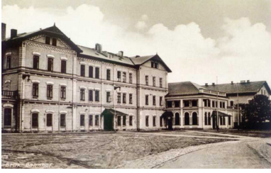
Dworzec kolejowy w starym Moście, około 1900.