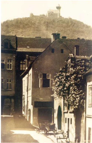
Ulica w dawnym Moście u podnóża wzgórza zamkowego, około 1890.

Jednakże dziś na próżno szukać miasta w ofertach biur podróży, katalogach czy folderach wycieczkowych. O Moście nie ma też informacji w licznie wydawanych i bogato ilustrowanych przewodnikach po Czechach. Dlaczego? Aby móc odpowiedzieć na to pytanie należy cofnąć się do epoki triumfu funkcjonalności, centralnego planowania, monumentalności świadczącej o potędze, „przyjaźni narodów”; słowem do czasów ZSRS.