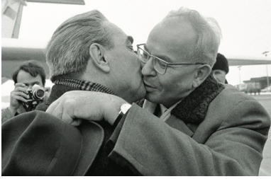
Leonid Breżniew i Gustáv Husák

z «Solidarnością», „Niezależne związki u nas”.