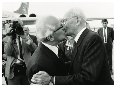
Erich Honecker i Gustáv Husák

Opinie te były niepożądane dla władz czechosłowackich, które w okresie kulminacji strajków w PRL obawiały się, że może dojść do paniki i wykupywania towarów. Wiedzano, że społeczeństwo czechosłowackie dość łatwo ulega różnego rodzaju pogłoskom, czego przykładem była panika rynkowa w połowie 1979 r. Dlatego w sierpniu 1980 r. władze w Pradze przykładały dużą uwagę do możliwie pełnego i płynnego zaopatrzenia sklepów.