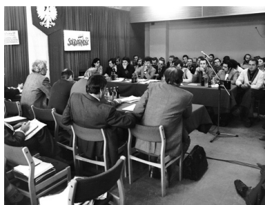
Negocjacje Komisji Rządowej z Międzyzakładowym Komitetem Założycielskim NSZZ „Solidarność” z siedzibą w Hucie „Katowice”, Dąbrowa Górnicza, październik 1980 r. Autor nieznany. Fot. ze zbiorów Międzyzakładowej Organizacji