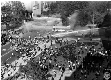
Czerwiec 1976 - radomskie walki uliczne Polaków z siłami reżimu Gierka.