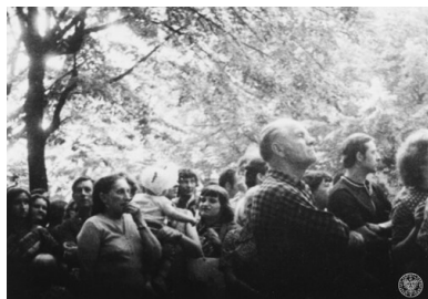
Demonstracja przed siedzibą KW PZPR w Płocku - 1976, czerwiec.

Brożyny) oraz katowania zomowskimi pałkami osób zatrzymanych w Radomiu i Ursusie na tzw. ścieżkach zdrowia, urządzanych w aresztach i komendach MO. Traktowano w ten sposób nie tylko czynnych uczestników zajęć, ale także przypadkowo schwytanych przechodniów. Również takie osoby trafiły następnie przed kolegia ds. wykroczeń, które orzekały kary trzy- i dwumiesięcznego aresztu (w sumie dla 314 osób). Przed kolegia trafiły łącznie 353 osoby, z tego 214 w Radomiu, 131 w Warszawie i osiem w Płocku.