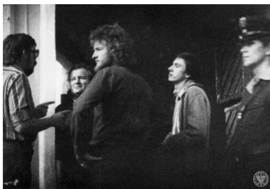
1976, czerwiec, demonstracja przed siedzibą KW PZPR w Płocku.

Wydarzenia z Radomia i Ursusa wyeksponowano, by narracja o zamieszkach, podpaleniach, sabotażu „przykryła” o wiele liczniejsze, i pokojowe, strajki w niemal połowie PRL. W publicznym odbiorze czerwcowe protesty miały się zapisać jako pojedyncze, odizolowane przypadki działalności „warchołów” i „chuliganów”.