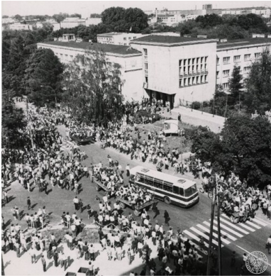
Radom, demonstracja przed gmachem KW PZPR podczas Czerwca`76.