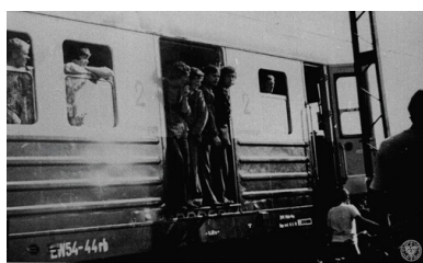
1976, czerwiec, Ursus, demonstranci spychają lokomotywę z rozkreczonych torów.

krótko, ponieważ ekipa Gierka błyskawicznie ogłosiła, że podwyżek jednak nie będzie. Do Radomia i Ursusa publiczną uwagę przykuły z kolei nie tylko gwałtowne formy protestu oraz skala i brutalność represji, lecz także przeprowadzona przez komunistów operacja propagandowa. W jej ramach wydarzenia z Radomia i Ursusa zostały wyeksponowane po to, by narracja o zamieszkach, podpaleniach oraz sabotażu „przykryła” o wiele liczniejsze akcje strajkowe w niemal połowie kraju, mające przebieg pokojowy. W publicznym odbiorze czerwcowe protesty miały się zapisać jako pojedyncze, odizolowane przypadki działalności „warchotów” i „chuliganów”.