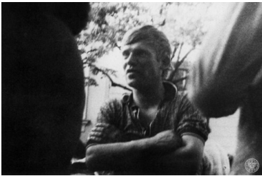
Przed siedzibą KW PZPR w Płocku: 1976, czerwiec.