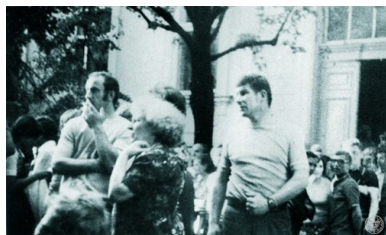
Demonstracja przed siedzibą KW

W dziejach PRL podwyżki lub zapowiedzi podwyżek cen podstawowych artykułów żywnościowych często prowadziły do tzw. niepokojów społecznych w postaci strajków i demonstracji ulicznych, zaś te ostatnie – w momencie prób ich pacyfikacji przez MO – łatwo przeradzały się w zamieszki. Nie inaczej stało się 25 czerwca 1976 r., nazajutrz po sejmowym wystąpieniu ówczesnego premiera Piotra Jaroszewicza, w którym ten de facto zapowiedział rychły wzrost cen wielu podstawowych artykułów żywnościowych (cukier, mięso, ryby, masło, sery, produkty zbożowe, warzywa, owoce) o co najmniej kilkadziesiąt, a nawet o ponad 100 procent. Prowokacyjną cechą „projektu”, który 25 czerwca miał rzekomo zostać poddany „konsultacjom społecznym”, był także niekorzystny dla obywateli o niższych dochodach system rekompensat. Mimo starannego pod względem propagandowym przygotowania przez władze PRL „operacji cenowo-dochodowej”, co miało oswoić Polaków z tezą o jej konieczności z powodów ekonomicznych, nazajutrz po przemówieniu Jaroszewicza doszło do burzliwych „konsultacji społecznych”.