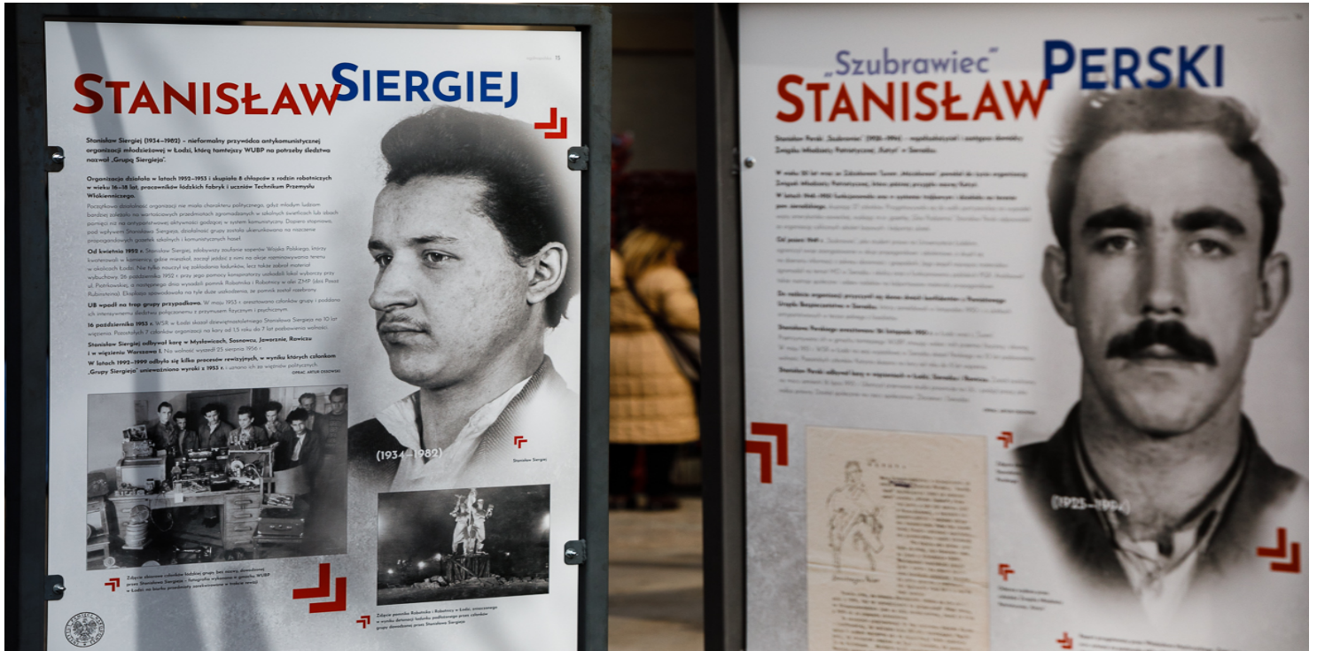
Plansza z wystawy „Zapomniane ogniwo. Konspiracyjne organizacje młodzieżowe na ziemiach polskich w latach 1944/45-1956” - Warszawa, 1 marca 2019.

https://przystanekhistoria.pl/pa2/tematy/demonstracje/98424,Strajk-studentow-i-uczniow-Lublina-w-styczniu-1947-r.html