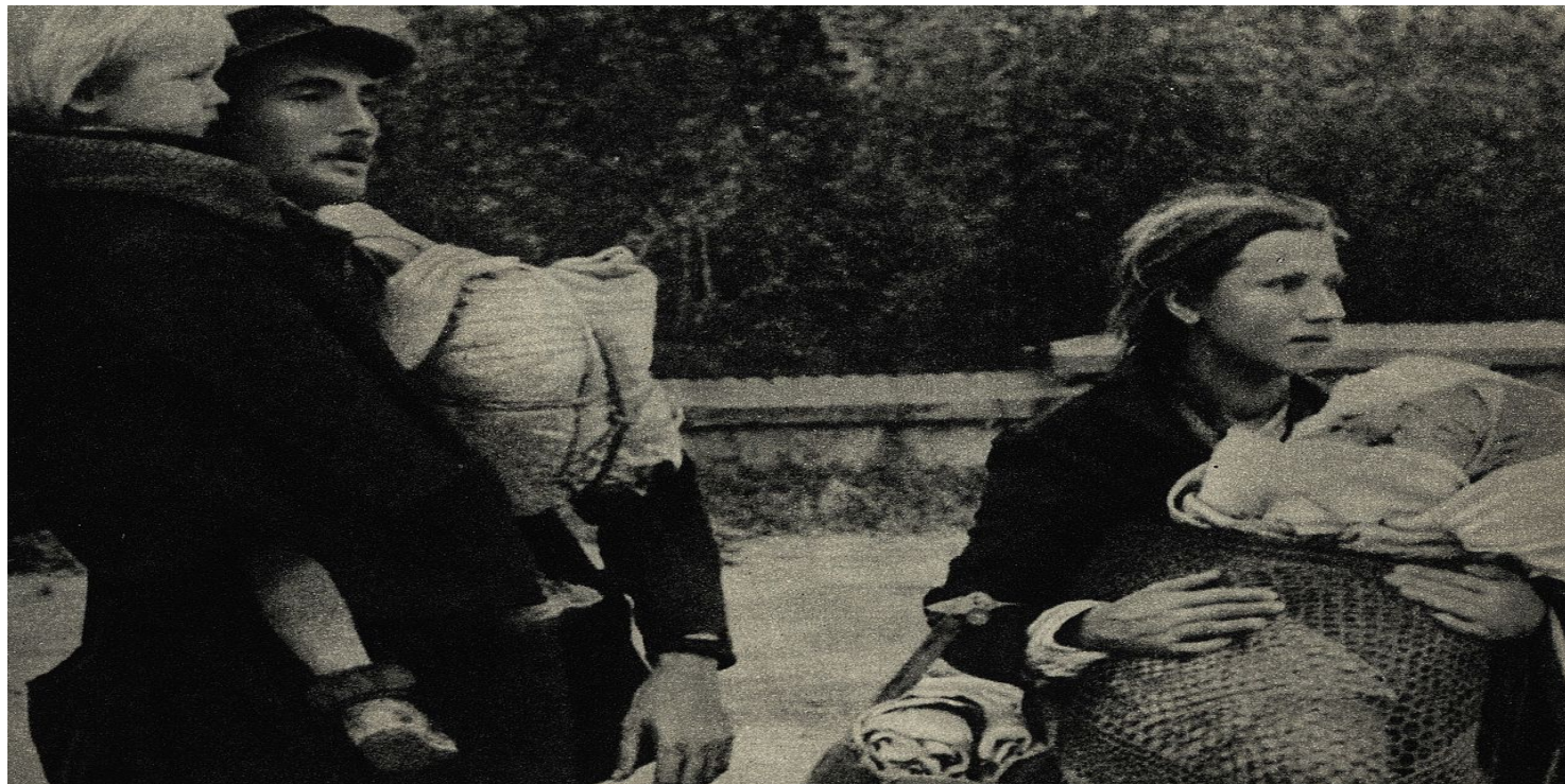
Polscy cywile opuszczający Warszawę podczas rozejmu w trakcie walk powstańczych, 7 września 1944 r. (domena publiczna)

https://przystanekhistoria.pl/pa2/tematy/dzieci/100081,Ciezarne-robotnice-przymusowe-w-obozie-przejsciowym-w-Pile-Durchgangslager-Schne.html