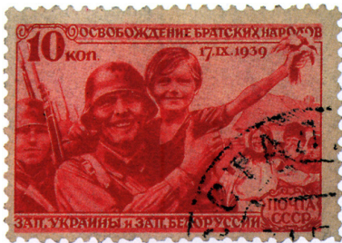
Sowiecki znaczek pocztowy upamiętniający wcielenie Zachodniej Ukrainy i Białorusi do ZSRR