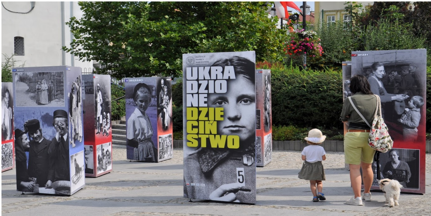
Wystawa IPN „Ukradzione dzieciństwo” – Przemyśl, 2019 r.

https://przystanekhistoria.pl/pa2/tematy/dzieci/104259,Wywiezienie-do-III-Rzeszy-i-repatriacja-Jozefa-Niedbaly.html