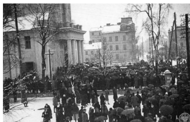
Pogrzeb wysiedleńców z Zamojszczyzny w Siedlcach. Wynoszenie trumien przez wiernych z kościoła pw. św. Stanisława Biskupa i Męczennika, 3 II 1943 r.