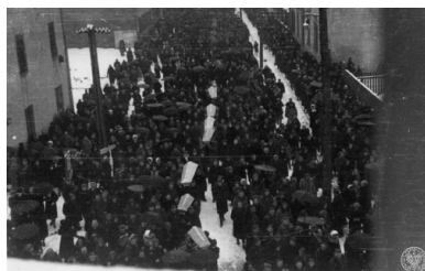
Pogrzeb wysiedleńców z Zamojszczyzny w Siedlcach. Kondukt pogrzebowy na ul. Szpitalnej. Zdjęcie wykonane z okna Ubezpieczalni Społecznej przy ul. 1 Maja. Autor: Tadeusz Zbigniew Castelli, 3 II 1943 r. (fot. z zasobu IPN)