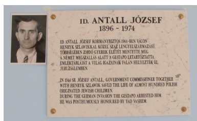
Tablica pamiątkowa na cmentarzu w Vácu.

W mistyfikację wtajemniczony został też, za pośrednictwem hr. Szapáry, nuncjusz apostolski na Węgrzech abp Angello Rotta, duchowny sprzyjający Polakom i z wielkim zaangażowaniem uczestniczący w dziele ratowania Żydów z różnych krajów (szczególnie w 1944 r., po wkroczeniu na Węgry Niemców), który odwiedził – oficjalnie katolicki – sierociniec. Nauka w szkole realizowana była w zakresie 7-klasowej szkoły powszechnej, według przedwojennego programu. Działał samorząd uczniowski, mały sklepik z niezbędnymi przyborami szkolnymi, redagowano własną gazetkę o wymownym tytule Przystanek na wędrówce . Dzieci miały więc namiastkę normalnego życia.