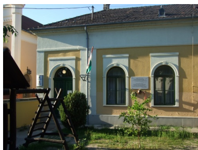
Budynek sierocińca w Vácu, 2017

Biorąc pod uwagę względy bezpieczeństwa, postanowiono, że placówka zostanie zorganizowana poza stolicą, oficjalnie jako „Dom Sierot Polskich Oficerów”. Sierociniec, na który składał się internat, mieszkania dla nauczycieli i mała szkoła, uruchomiony został pod koniec lipca 1943 roku. Ulokowany został w budynku znajdującym się – jakby symbolicznie – między pięknym kościółkiem a stylową synagogą. Obowiązkową, urzędową kontrolę domu dziecka powierzono sprzyjającemu Polakom policjantowi, a tylko wtajemniczeni wiedzieli o faktycznej działalności placówki.