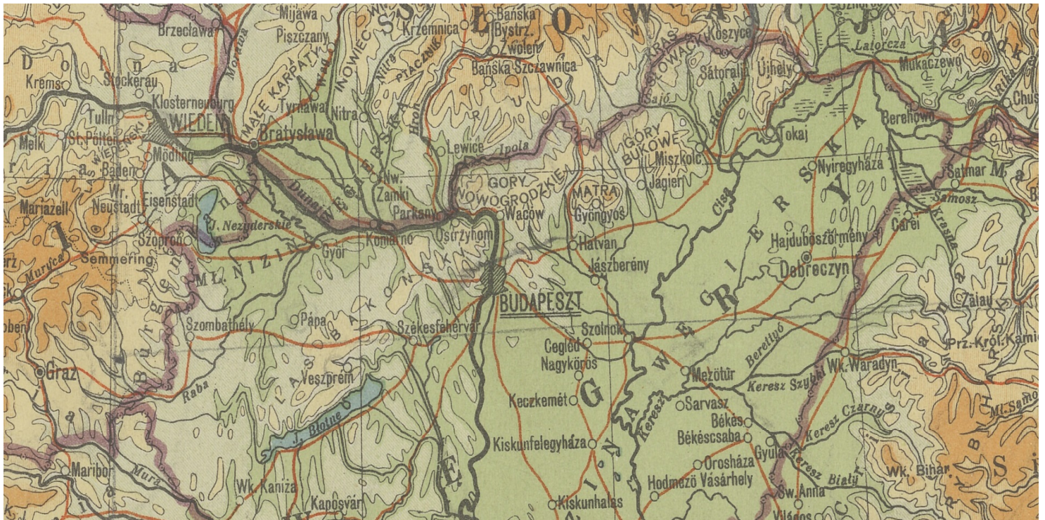
Vác (dawniej pol. Waców) położony na północ od Budapesztu (E. Romer, Powszechny Atlas Geograficzny, 1934)

https://przystanekhistoria.pl/pa2/tematy/dzieci/98020,Sierociniec-w-Vacu.html