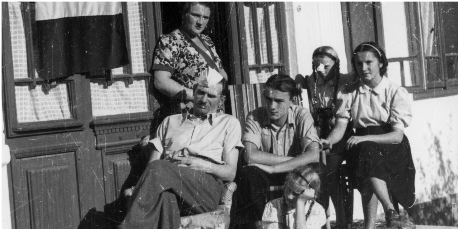
Uchodźcy polscy w Rumunii, 1939/1940 r. Fot. NAC

https://przystanekhistoria.pl/pa2/tematy/edward-smigly-rydz/78668,Polscy-uchodzcy-w-Cmpulung-Mucel-w-Rumunii.html