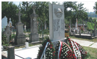
Câmpulung-Mușcel, cmentarz Flamandzki, mogiła uchodźców polskich, zmarłych w latach 1939-1944 r.