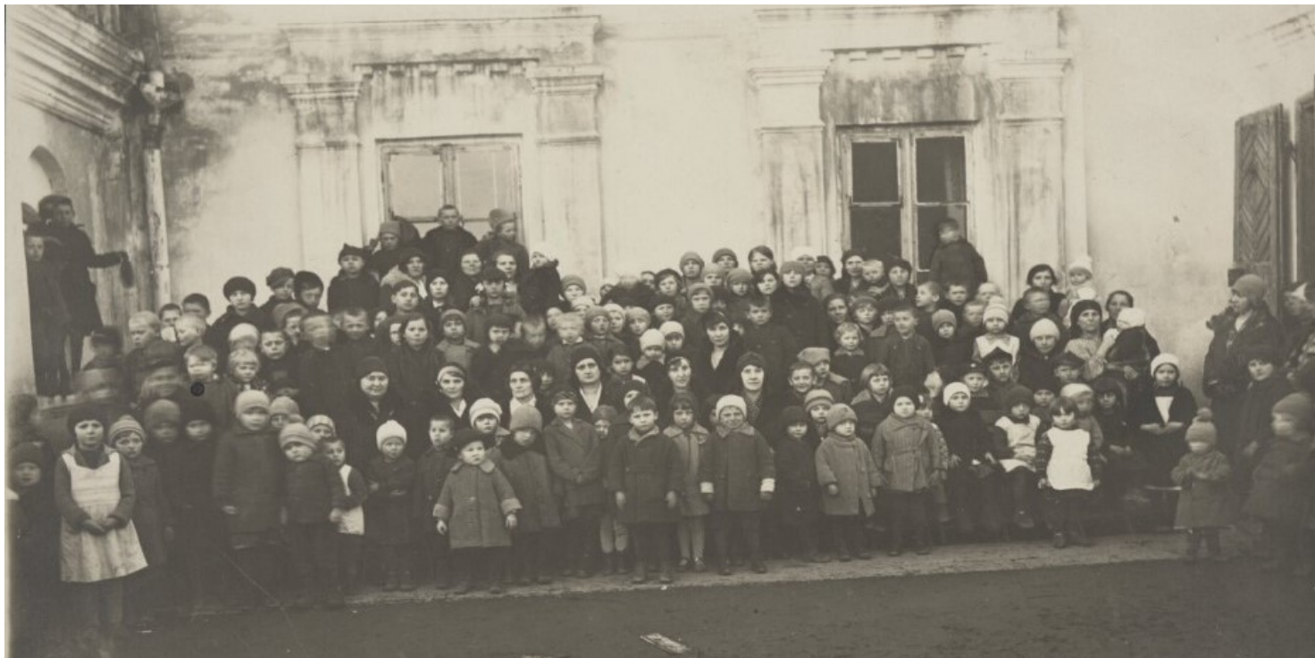
Dziewięć Sieradza zgromadzona na podwieczorku urządzonym przez Związek Pracy Obywatelskiej Kobiet z okazji imienin Marszałka Polski Józefa Piłsudskiego, 24 marca 1931 r.

https://przystanekhistoria.pl/pa2/tematy/edward-smigly-rydz/78674,Najwazniejszy-dzien-dla-pilsudczykow-Rzecz-o-imieninach-Pierwszego-Marszalka-Pol.html