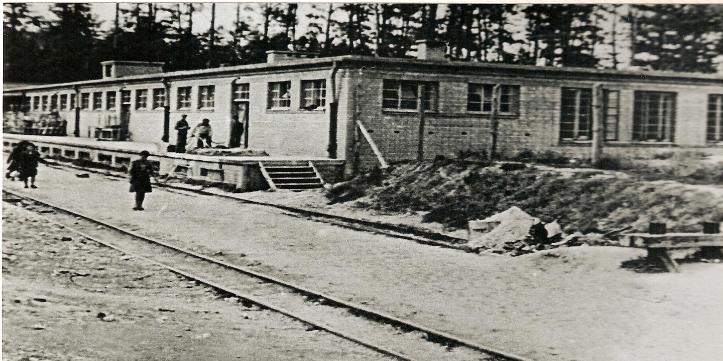
Niemiecki obóz pracy SS w Poniatowej. Hala nr 2, rampa kolejowa i magazyny. Ze zbiorów Prokuratury przy Sądzie Krajowym w Hamburgu

https://przystanekhistoria.pl/pa2/tematy/einsatz-reinhardt/90185,Erntefest-Dozynki-4-listopada-1943-r-egzekucja-zydowskich-wiezniow-obywateli-aus.html