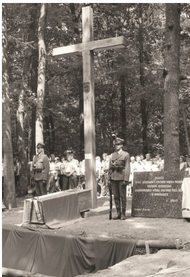
Msza św. 10 sierpnia 1991 r. wraz z pochówkiem polskich oficerów ekshumowanych w Charkowie-Piatichatkach.