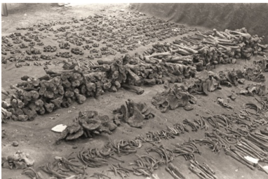
Posegregowane kości polskich oficerów podczas ekshumacji w Charkowie-Piatichatkach latem 1991 r.