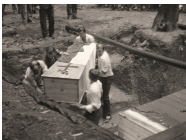
Symboliczny pochówek dziesiątej trumny ze szczątkami polskich oficerów ekshumowanych w Charkowie-Piatichatkach 10 sierpnia 1991 r.

Pracownicy Energopolu wykonali dziewięć skrzyń-trumien z krzyżem, w których umieszczono kości i czaszki polskich oficerów. Składano je do dołu śmierci i przykrywano biało-czerwoną flagą. Dziesiątą trumnę miano