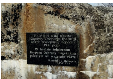
Tablica pamiątkowa poświęcona żołnierzom KOP na ścianie schronu w Tynnem.

Zanim doszło do agresji sowieckiej, żołnierze batalionu KOP „Sarny” czekali na przetrzucenie transportem kolejowym na front zachodni. Po zbombardowaniu przez Niemców 16 września stacji w Równem, a wkrótce przez Sowietów węzła w Sarnach ruch kolejowy na linii Sarny-Równe ustał.