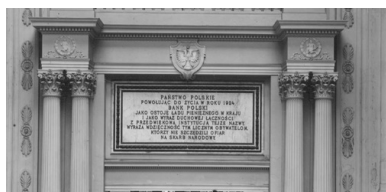
Tablicą znad wewnętrznej strony wejścia do głównej sali Banku Polskiego przy ulicy Bielańskiej 10 w Warszawie, kwiecień 1928 r.