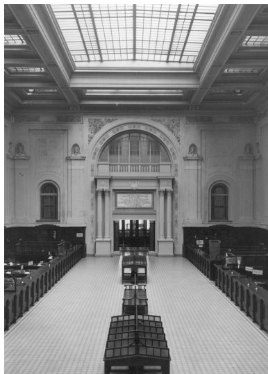
Główna sala Banku Polskiego przy ulicy Bielańskiej 10 w Warszawie, kwiecień 1928 r.

- w Szwajcarii, Szwecji, Wielkiej Brytanii (ponad 100 mln zł) - a także w Siedlcach (ponad 80 mln zł), Brześciu nad Bugiem (40 mln zł), Zamościu (ponad 30 mln zł) i Lublinie (ponad 20 mln zł). Powyższe dane zostały ustalone m.in. na podstawie niekompletnych dokumentów przechowywanych w Archiwum Akt Nowych w Warszawie.