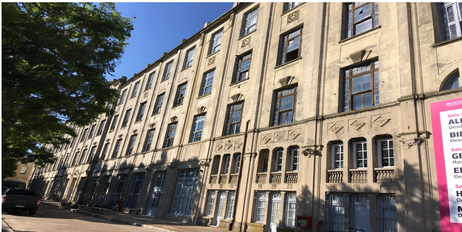
Budynek, w którym mieścił się hotel imigrantów (zbudowany w 1906 r.) – dziś siedziba Muzeum Imigracji w Buenos Aires

https://przystanekhistoria.pl/pa2/tematy/emigracja/69405,Jest-taki-kraj-Jest-taka-biblioteka.html