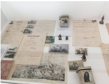
Zbiory Muzeum Imigracji w Buenos Aires dot. żołnierzy 2 Korpusu Polskiego