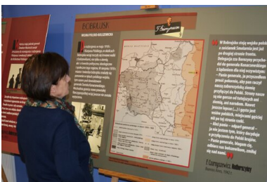
Wernisaż wystawy przygotowanej