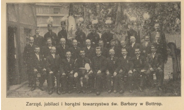
Zarząd, jubilanci i horązni towarzystwa św. Barbary w Bottrop.

górnicy, którzy wnet zaczęli stanowić 1/3 ogółu pracowników kopalń. Dysponowali oni od 1902 r., co należy podkreślić, własnym związkiem zawodowym. Mniejsze polskie skupiska można było jeszcze spotkać w środkowych Niemczech, w portowych ośrodkach takich jak Hamburg czy Kilonia. Ogółem przed wybuchem wojny mieszkało tam na stałe co najmniej 800 tysięcy osób.