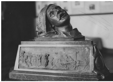
Rzeźba w brązie dłuta artysty rzeźbiarza Teofila Lenartowicza Umierający powstaniec w drodze na Syberię.

Zdecydowana większość Polaków mieszkała jednak w dużych ośrodkach miejskich i przemysłowych. Przeważała inteligencja techniczna, głównie inżynierowie, znaczną część stanowili wykwalifikowani robotnicy. Spośród innych zawodów byli: dziennikarze, lekarze, fotografowie, adwokaci, aptekarze, nauczyciele, architekci, malarze, oficerowie i dwie szczególnie duże grupy – urzędnicy oraz służba domowa. Największym, bo prawie siedemdziesięcioletnim, skupiskiem Polaków był Petersburg (spora grupa robotników oraz średniego personelu technicznego pracowała w słynnych w późniejszym okresie zakładach Putiłowa), a następnie Ryga (47 tys.), Odessa i Moskwa (ponad 20 tys.). Na Syberii największe polskie kolonie znajdowały się w Irkucku, Tomsku, Tobolsku i Omsku, a poza tym po kilka tysięcy osób mieszkało przykładowo w Charkowie, Tyflisie [dziś: Tbilisi], Baku, Samarze a nawet Władywostoku.