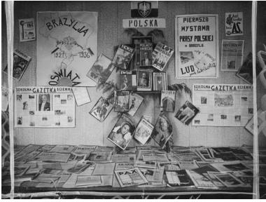
Pierwsza wystawa prasy polskiej w Brazylii, 1936 r.

Wychodźcy z Galicji trafili nie tylko do Brazylii. Część spośród nich w czerwcu 1897 r. znalazła się w argentyńskiej prowincji Misiones, stykającej się z Paraną. Chłopi spod Buczacza i Obertyna, odrzuceni w Hamburgu przez komisję lekarską, zaokrętowali się na statek zmierzający do Buenos Aires, tam zaś przyjaciel gubernatora Misiones, Michał Szelągowski, zasugerował, by osadzić ich w żyznej, rozległej, ale też wyjątkowo niebezpiecznej okolicy nad rzeką Chimiray. Ci pierwsi, walcząc z puszcza, plagą szarańczy oraz inwazjami mrówek, nie tylko przetrwali, ale i zyskali uznanie miejscowych urzędników. Pisano o nich w raportach, iż są