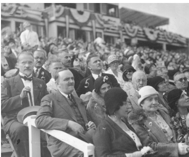
Publiczność obserwująca Wyścigi lotnicze podczas Dnia Polskiego

Przybysze z Polski skupiali się przede wszystkim w miastach. Podejmowali pracę w kopalniach antracytu w Pensylwanii, w fabrykach metalurgicznych, portach i stoczniach wschodniego wybrzeża, chicagowskich rzeźniach, potem w zakładach produkujących samochody. Kobiety zatrudniały się w hotelach, w fabrykach włókienniczych, jako służące. Największa ich liczba znalazła się w polskiej stolicy Stanów – Chicago – gdzie przed I wojną światową mieszkało około 400 tysięcy Polaków, co stanowiło drugie po Warszawie polskie skupisko w świecie. W Nowym Jorku przebywało 200 tysięcy Polaków, ponad 100 tysięcy w Detroit, Buffalo i Milwaukee, około 50 tysięcy w Cleveland i Baltimore.