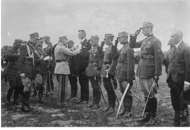
Marszałek Józef Piłsudski dekoruje byłych oficerów Brygady Syberyjskiej, 1922 r.