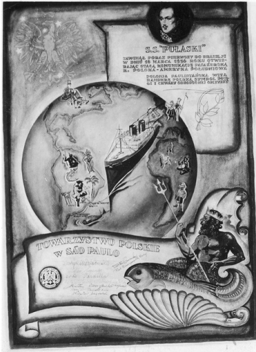
Fotografia dyplomu, który został wręczony kapitanowi statku SS Pułaski przez Towarzystwo Polskie w Sao Paulo, 1936 r.

W 1888 r. zostało w Brazylii zniesione niewolnictwo. Masowo opuszczane przez Murzynów plantacje nie miały wystarczającej liczby rąk do pracy. Rząd brazylijski usiłując zminimalizować skutki gospodarcze aktu wyzwolenia zmuszony był sięgnąć po robotnika z Europy. Akcja werbunkowa wywołała na ziemiach polskich prawdziwą „gorączkę brazylijską”. Obiecywano przecież nie tylko darmowy przejazd, ale i bezpłatne nadanie ziemi. Podawana z ust do ust wieść gminna głosiła, że otrzymać można 60, 100, a nawet 130 mórg ziemi, zboże na zasiew i bydło robocze.