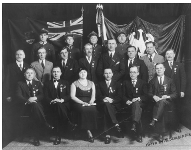
Uroczystość w Toronto z okazji 15-lecia zorganizowania Armii Polskiej w Kanadzie, 1932 r.

Największym polskim skupiskiem w Kanadzie było jednak Toronto. Polacy pojawili się w tym mieście po powstaniu styczniowym, skupiając się u schyłku XIX w. w organizacji Association of Polish Citizens . W 1901 r. Polaków było już ponad trzy tysiące, a przed wybuchem wojny ich liczba wzrosła do około 20 tysięcy. W 1907 r. powstała też w Toronto organizacja „Synowie Polski”, poprzedniczka „Związku Polaków w Kanadzie”.