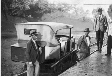
Polscy osadnicy ze stanu Parana w Brazylii, 1934 r.

Nie mogło też zabraknąć Polaków w szeregach oddziałów powstańczych. Walczyli oni u boku Juareza w Meksyku, brali udział w argentyńskich zmaganiach o niepodległość w latach 1812–1819, służyli w walczących z Hiszpanami siłach gen. Francisca de Mirandy w Wenezueli, a potem w armii Simóna Bolívara. W armii argentyńskiej walecznością i męstwem wyróżnił się, awansowany w wojnie paragwajskiej na polu bitwy do stopnia generała, Teofil Iwanowski. Do takiegoż stopnia doszedł w powstańczej armii kubańskiej w 1869 r. Karol Roloff Miałowski, w późniejszym czasie generalny inspektor armii i minister skarbu Kuby.