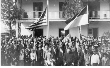
Mieszkańcy polskiej osady w Teksasie podczas lokalnej uroczystości, 1930 r.