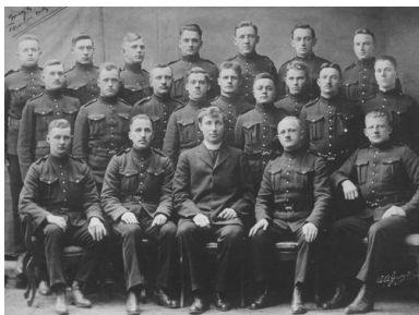
Grupa polskich uczniów i absolwentów szkoły oficerskiej w Toronto, 1917 r.