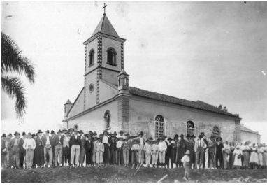
Polski kościół w Grao Para w stanie Santa Catarina, 1929 r.