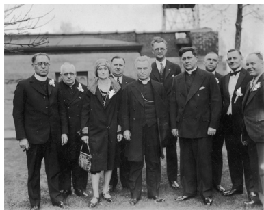
Jubileusz 25 lecia parafii św. Jana Kantego w Indiana Harbor, 1930 r.