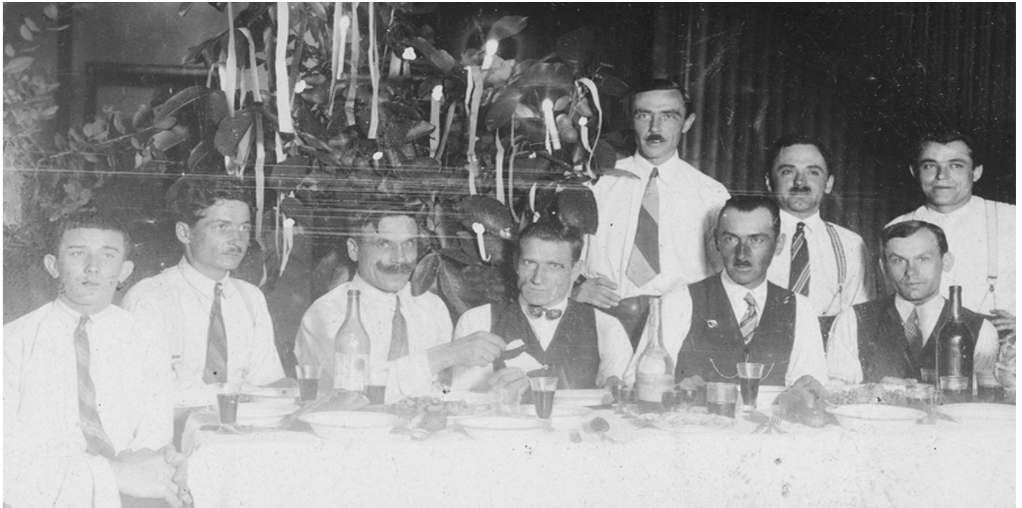
Wigilia dla polskich emigrantów w Argentynie, lata 30. XX w.

https://przystanekhistoria.pl/pa2/tematy/emigracja/88081,Za-chlebem.html