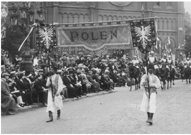
Członkowie belgijskiej Polonii, "składający hołd Janowi III Sobieskiemu" podczas Międzynarodowego Pochodu Brylantów i Drogocennych Kamieni w Antwerpii, 1923 r.

osób, osiedliła się w Danii. Wychodźcy, w tym niemała grupa młodych kobiet, podejmowali tam pracę przede wszystkim na plantacjach buraka cukrowego. Północny szlak kończył się w południowej Szwecji, natomiast na zachodzie, poza obszarami niemieckimi, Polaków można było spotkać w Holandii, Belgii i Francji. Wyjazdy do dwu ostatnich krajów, do pracy w kopalniach węgla, przybrały na sile dopiero po zakończeniu I wojny światowej. Niewielkie, kilkusetosobowe grupy znajdowały się nawet w rolniczych kantonach Szwajcarii. W Wiedniu i Budapeszcie istniały natomiast spore polskie kolonie o wyraźnym charakterze urzędniczo-rzemieślniczym.