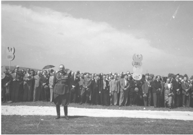
Zjazd Legionistów w Krakowie w 1939 r. Na pierwszym planie stoi gen. bryg. Zygmunt Piasecki

Postanowił jednak walczyć dalej. Chciał się przedostać przez Rumunię do Francji, gdzie odtwarzane było polskie wojsko, ale po internowaniu przez władze rumuńskie został przekazany Niemcom, którzy osadzili go w Oflagu VII A Murnau.