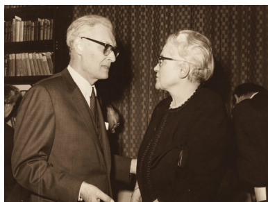
Kazimierz Wierzyński i Karolina Lanckorońska w Bibliotece Polskiej w Londynie, 1969 r.

Poglądy filozoficzne Lanckorońskiej wyrastały nie tylko z ogromnej wiedzy, lecz przede wszystkim z długich i zróżnicowanych doświadczeń życiowych. Pamiętała czasy sprzed I wojny światowej, a cesarza Franciszka Józefa oraz ministrów monarchii austro-węgierskiej poznała osobiście. Ze światem nowoczesnym zaznajomiła się jeszcze wszechstronniej – od salonów arystokratycznych i auli uniwersyteckich po przesłuchania NKWD i gestapo oraz pobyty w więzieniach i obozie koncentracyjnym; aktywnie przetrwała epokę zniewolenia jej rodzinnej Europy i dwukrotnie doczekała niepodległości Polski. Jej doświadczenia w przestrzeni geograficznej i kulturowej też są imponujące. Bardzo dobrze znała zachodnią Europę, długo żyła w państwach demokratycznych, ale dane jej było również zaznać rozmaitych form istnienia w ustrojach totalitarnych: rosyjskiego komunizmu i niemieckiego narodowego socjalizmu.