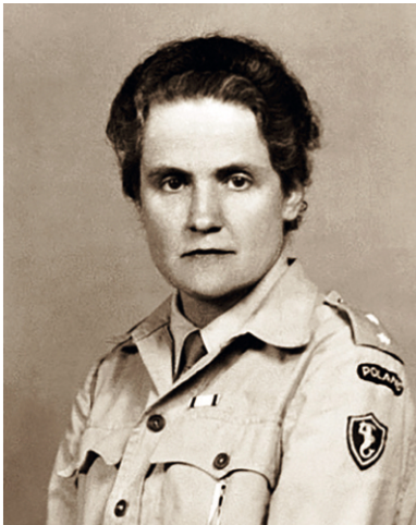
Karolina Lanckorońska we Włoszech jako oficer prasowy przy 2. Korpusie Polskich Sił Zbrojnych na Zachodzie, 1945 r.