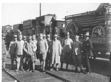
Żołnierze Armii Polskiej we Francji stojący na torowisku przy pociągu z transportem sprzętu wojskowego do Polski, 1919 r.

Warto zdać sobie sprawę, iż na 72 służących w tym pułku oficerów z armii francuskiej wywodziło się 20, z