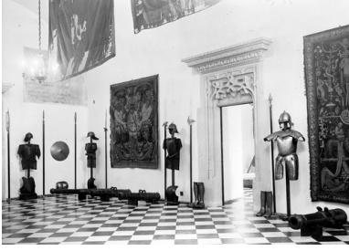
Zbrojownia Muzeum na Wawelu, 1930 r.

Następnego dnia cenny ładunek był już w Krzemieńcu. Postanowiono, że przekroczenie granicy z Rumunią nastąpi w Kutach. 18 września o godz. 2.30 transport wjechał na most graniczny na Czeremoszu.