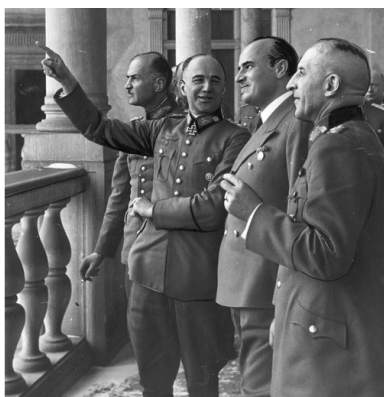
Niemieccy generałowie z wizytą u okupacyjnego gubernatora Hansa Franka na Wawelu.

Władze w Warszawie nie były zbyt zadowolone, że wydano 2500 zł, ale jak się wkrótce okazało, bez tych przygotowań, szybka ewakuacja skarbów nie byłaby możliwa. Wawelskie precjoza podzieliłyby zapewne los wielu innych pamiątek i skarbów narodowych zagrabionych przez okupantów.