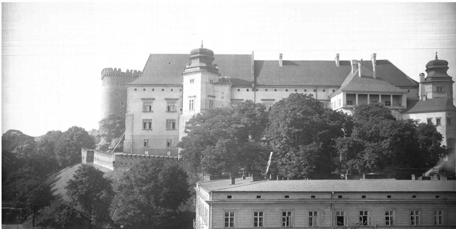
Wschodnie skrzydło Zamku Królewskiego na Wawelu, 1929 r. Fot. ze zbiorów NAC

https://przystanekhistoria.pl/pa2/tematy/emigracja/99484,Jozef-Krzywda-Polkowski-1888-1981.html