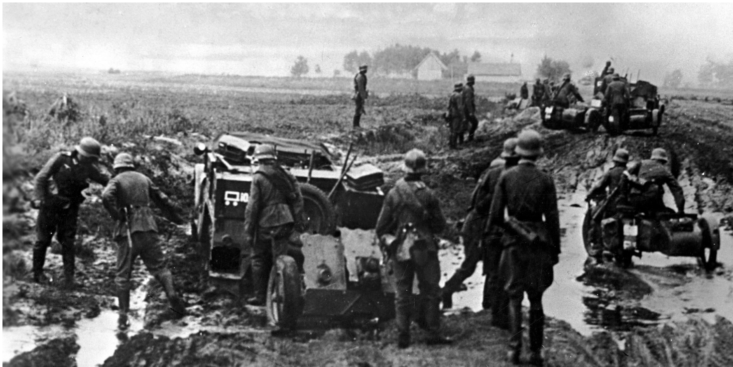
Kadr z niemieckiego filmu propagandowego o podboju Polski, 1939 r.

https://przystanekhistoria.pl/pa2/tematy/fotografia/100138,Niemy-swiadek-dzialan-wojennych-czyli-historia-pewnej-fotografii.html