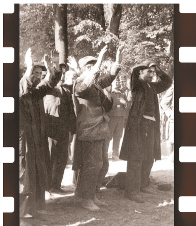
» Wielu Żydów zapędzonych do grabienia zwłok zostało później zastrzelonych przez żołnierzy niemieckich