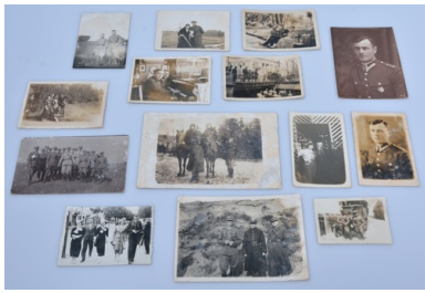
Zbiór fotografii rodzinnych Jadwigi i Zofii Klimkiewicz