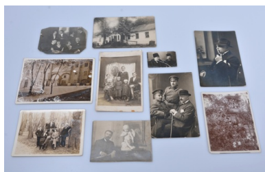
Zbiór fotografii rodzinnych