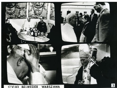
Powitanie Jana Pawła II przez władze PRL, 17 czerwca 1983 r.

W niniejszym tekście pragnę krótko przedstawić materiały, w których posiadaniu jest Oddziałowe Archiwum IPN w Gdańsku, a dotyczące pielgrzymek Jana Pawła II do PRL. Oczywiście najwięcej z nich związanych jest ze wspomnianą wcześniej wizytą papieża w Trójmieście, nie brak również jednak materiałów związanych z pielgrzymkami z lat 1979 oraz 1983.