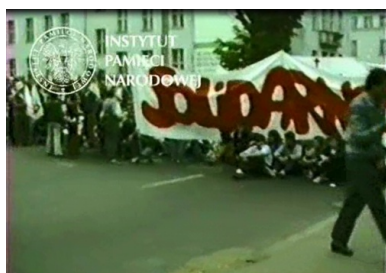
Kadr z filmu operacyjnego SB przedstawiający demonstrację, która przeszła ulicami Gdańska po mszy św. z udziałem Jana Pawła II na Zaspie, 12 czerwca 1987 r.