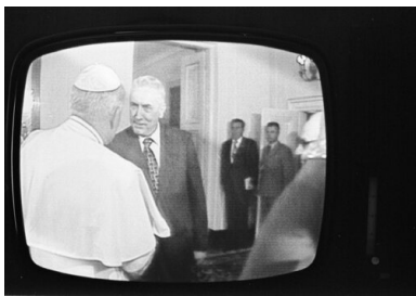
Ujęcie z relacji telewizyjnej z pierwszej pielgrzymki papieża Jana Pawła II do Polski w 1979 r.