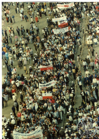
Demonstracja solidarnościowa, która przeszła ulicami Gdańska po mszy św. z udziałem Jana Pawła II na Zaspie, 12 czerwca 1987 r.

współorganizowali wizytę Jana Pawła II w Trójmieście.