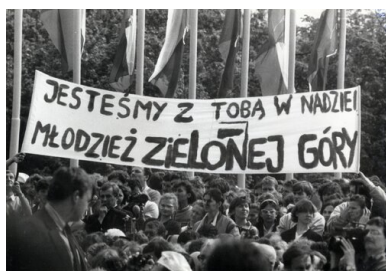
Uczestnicy spotkania Jana Pawła II z młodzieżą na Westerplatte, 12 czerwca 1987 r.

1987 r. Jednak ich specyfiką jest to, że w dość małym stopniu widoczna jest na nich postać papieża. Co najbardziej interesowało fotografów z resortu spraw wewnętrznych, to przede wszystkim uczestnicy uroczystości i transparenty, które mieli ze sobą. Widoczne jest to przede wszystkim na zdjęciach z uroczystości gdańskich na Westerplatte i na Zaspie. Niektóre z nich zrobione są tak, że można rozpoznać osoby trzymające solidarnościowe transparenty oraz znajdujące się w ich bezpośrednim sąsiedztwie. Co ciekawe, w odziedziczonym po SB zasobie nie ma zdjęć ze spotkania Jana Pawła II z chorymi i przedstawicielami służby zdrowia odbytego w gdańskim kościele mariackim. Najwięcej z kolei jest fotografii z budzących największe obawy komunistów uroczystości na Zaspie oraz późniejszej manifestacji solidarnościowej, która przeszła ulicami Gdańska.