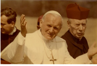
Jan Paweł II w towarzystwie kardynała Stefana Wyszyńskiego, Gębarzewo koło Gniezna, 3 czerwca 1979 r.